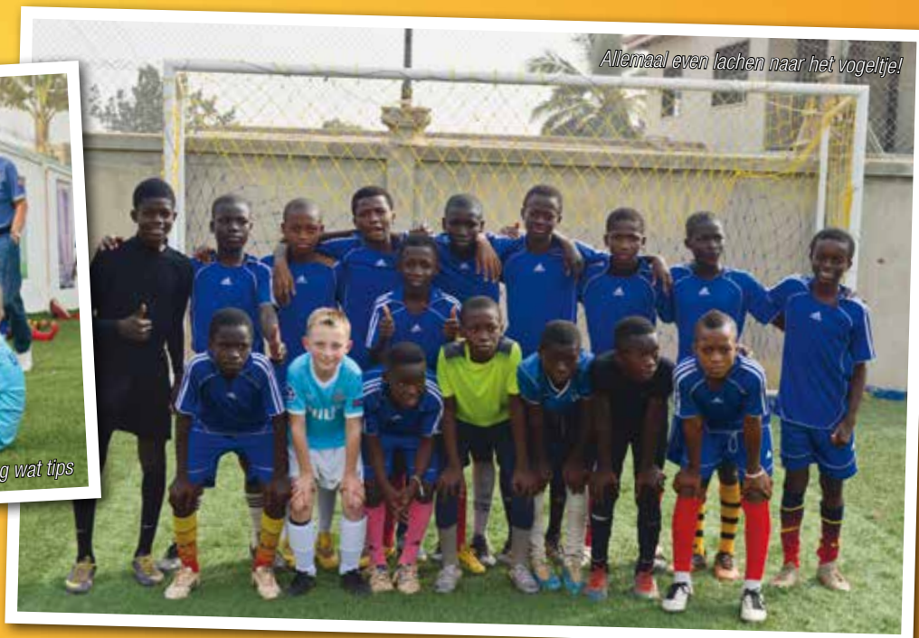
Allemaal even lachen naar het vogeltje!

zijn lijfje mogen laten stromen, vanaf de schouders. Ze waarschuwen hem als hij te diep de zee inloopt. Het is een mooi gezicht. Die lieve, verbaasde, vrolijke, donkere kinderen en dat witte ventje.